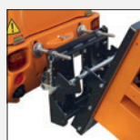
Artikelnr.: 73305 Zugmaulhalterung „klappbar“ inkl. 4 St. M20 Stellfüße