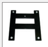
Artikelnr.: 72110 Ersatzradhalterung Bei der 170 I-Ausführung nicht empfohlen!