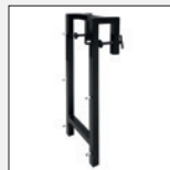
Artikelnr.: 72105 Bordwandhalterung Bei der 170 I-Ausführung nicht empfohlen!