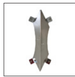
Artikelnr.: 81139 Entladungsdach Behälter