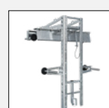
Artikelnr.: 77508 Pick-Up-Halterung verstellbar Feuerverzinkt, inkl. 4 St. M20 Stellfüße