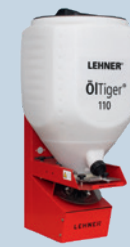
ÖlTiger® 110 I Artikelnr.: 71130