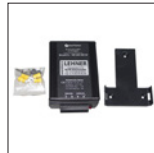
Artikelnr.: 72161 Spannungswandler von 24 Volt auf 12 Volt