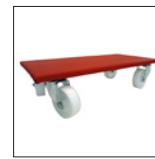
Artikelnr.: 70930 Rollwagen zum Abstellen und Transportieren des Streuers