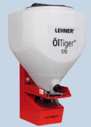
ÖlTiger® 170 I Artikelnr.: 73485