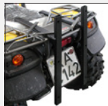
Artikelnr.: 72107 ATV/Quad-Halterung „Heck“ Bei der 170 I-Ausführung nicht möglich!