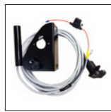
Artikelnr.: 72154 Batteriekabel inkl. Halterung, Kabellänge 5 m (1 St. serienmäßig)