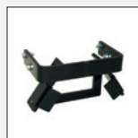
Artikelnr.: 72104 Gerätedreieck-Halterung