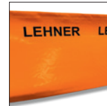
Artikelnr.: 72117 Spritzschutz 90 cm hoch mit Doppelhohlsaum/Meter (Bestellmenge bitte in lfm. angeben)