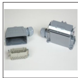
Artikelnr.: 312498 Alukupplung 16polig