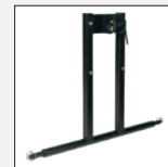
Artikelnr.: 72101 (KAT II) Dreipunktbock KAT 0 – Schultermaß 530 mm (72100) KAT I – Schultermaß 683 mm (72166) KAT II – Schultermaß 825 mm