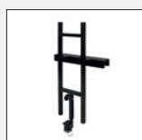
Artikelnr.: 72108 Pick-Up-Halterung Standard Bei der 170 I-Ausführung nicht empfohlen!