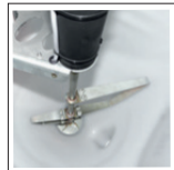
Artikelnr.: 72155 Salinen-Rührwerk für schwer fließfähige Streugüter