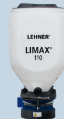
LIMAX® 110 I Artikelnr.: 73472