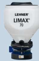
LIMAX® 70 I Artikelnr.: 73471