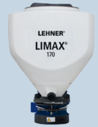
LIMAX® 170 I Artikelnr.: 73473