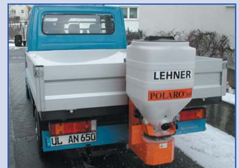
POLARO® 100 am Pritschenwagen