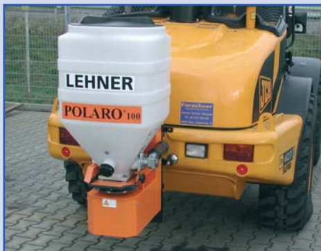
POLARO® 100 am Radlader