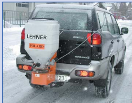
POLARO® 100 am Geländefahrzeug