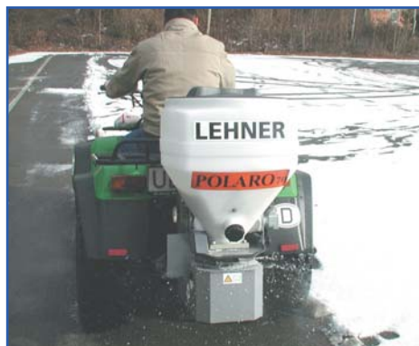
POLARO® 70 am ATV mit Schneeräumschild

Montagebohrungen sind im Rahmen auf der Rückseite und unten vorhanden. Dadurch ist es möglich, Streugut wie Salz, Splitt, Sand und Dünger ohne Spezialfahrzeuge zu streuen.