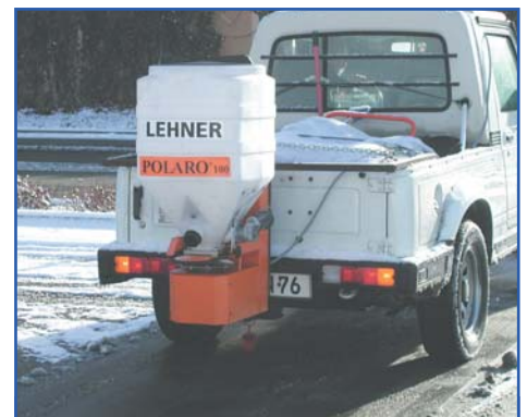
POLARO® 100 am Pritschenfahrzeug mit Schneeräumschild