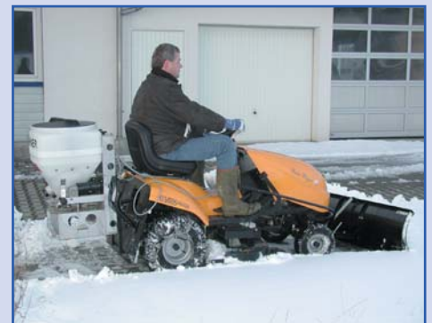
POLARO® 70 am Aufsitzmäher mit Schneeräumschild

Aufgrund des 12 Volt Antriebes kann der POLARO® überall angebaut werden.