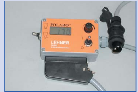
Bedienpult für die Fernbedienung

Durch die stufenlose Regulierung der Drehzahl des Streutellers kann die Streubreite von 0,8 m (Gehweg) bis 6 m (Bushaltestelle, Parkplatz) stufenlos während der Fahrt eingestellt werden.